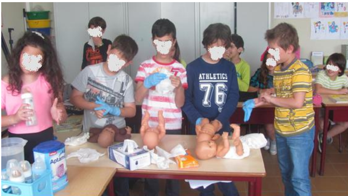
Aula de Educadora de Infância – 4º ano

Relativamente à Ação nº2 , esta foi divulgada junto dos encarregados de educação pelos professores titulares de turma, na reunião de avaliação do primeiro período. Houve uma boa adesão por parte dos pais/EE das turmas do 1º e 4º anos de escolaridade, havendo 4 aulas em cada turma. Por outro lado, nas turmas do 2º e 3º anos não houve adesões à proposta. Na turma do 1º ano foram apresentadas as seguintes profissões: doméstica, enfermeira, empregada de editora e professora do ensino secundário. Na turma do 4º ano foram apresentadas as profissões: educadora de infância, professora de educação evangélica, electromecânico e enfermeira.