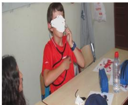
Aula de enfermagem – 4º ano