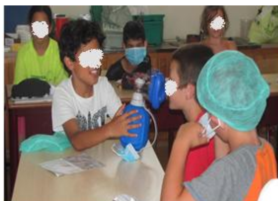
Aula de Enfermagem – 4º ano