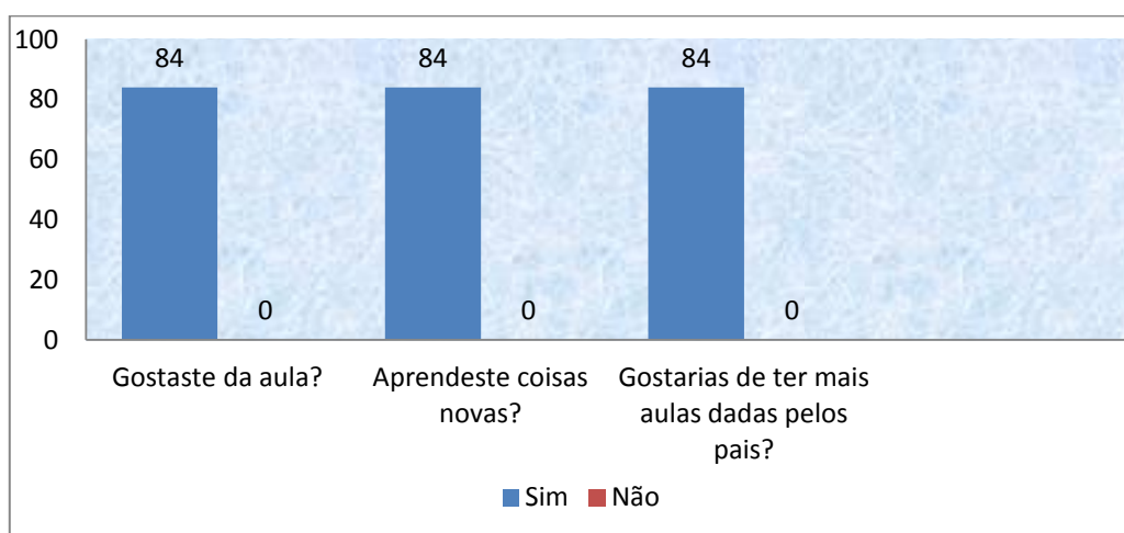
Gráfico 2 – Opinião dos alunos do 1ºano em relação às aulas dos pais/EE.

Após análise do gráfico pode-se concluir que todos os alunos do 1º ano gostaram das aulas, fizeram novas aprendizagens e consideraram que todos os pais deveriam participar.