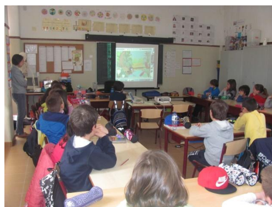
Aula de Educação Evangélica – 4º ano