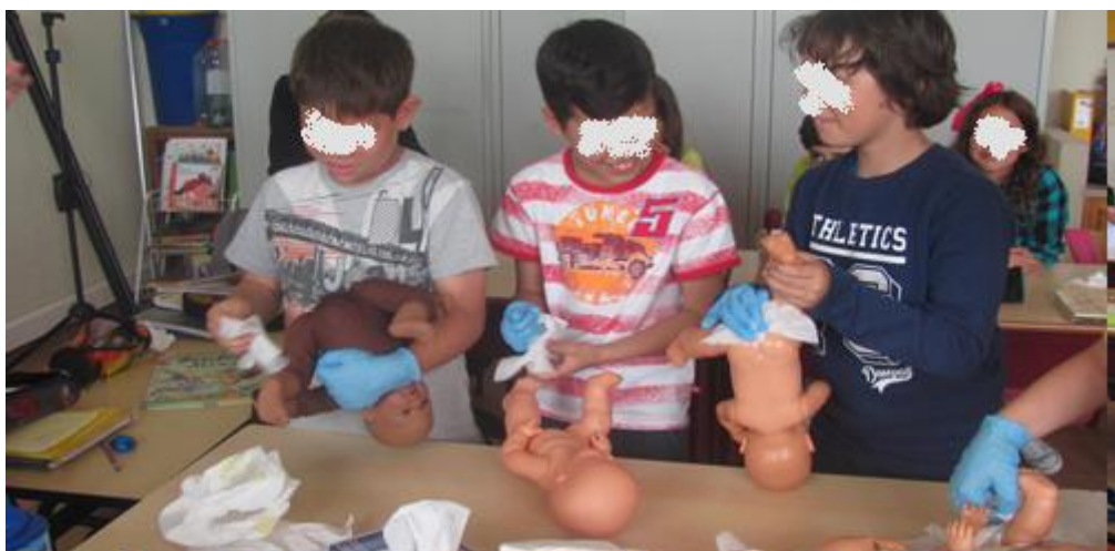
Aula de Educadora de Infância – 4º ano

Todos os pais/EE participantes articularam com os professores titulares de turma a apresentação dos temas e a adequação ao nível de ensino. No final de cada aula foi entregue aos Pais/EE e aos alunos um pequeno questionário de satisfação.