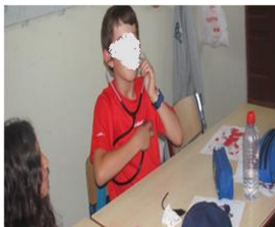
Aula de enfermagem – 4º ano