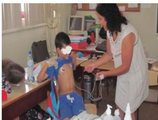
Aula de Enfermagem – 4º ano