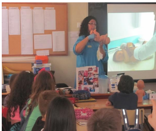
Aula de Educadora de Infância – 4º ano