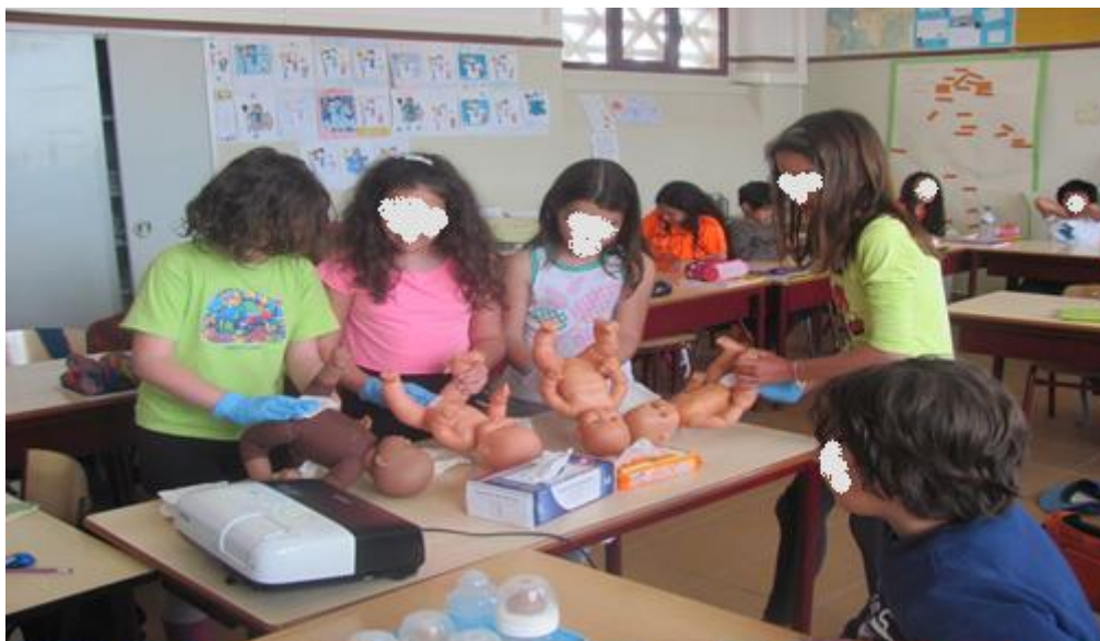
Aula de Educadora de Infância – 4º ano