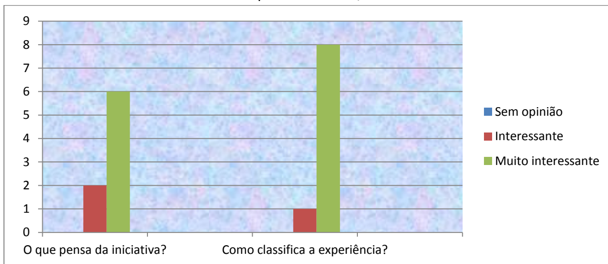
Gráfico 1 – Opinião dos Pais/EE acerca da actividade.

Os pais/EE que participaram nesta iniciativa acharam-na muito interessante e classificaram-na também como uma experiência igualmente interessante.