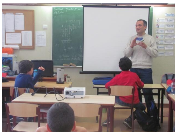
Aula de Eletromecânica – 4º ano