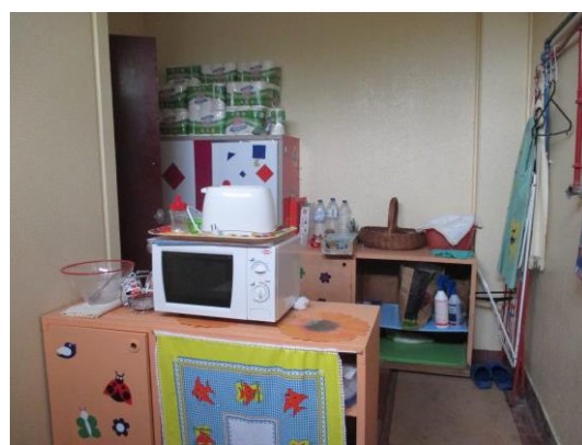
Sala para assistentes operacionais e arrecadação